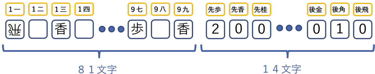
図2: 文字列エンコード

実際には文字列だと扱いづらいため、各文字が対応する数値IDに変換されて、95個の数値列がエンコードされた入力特徴量となります。